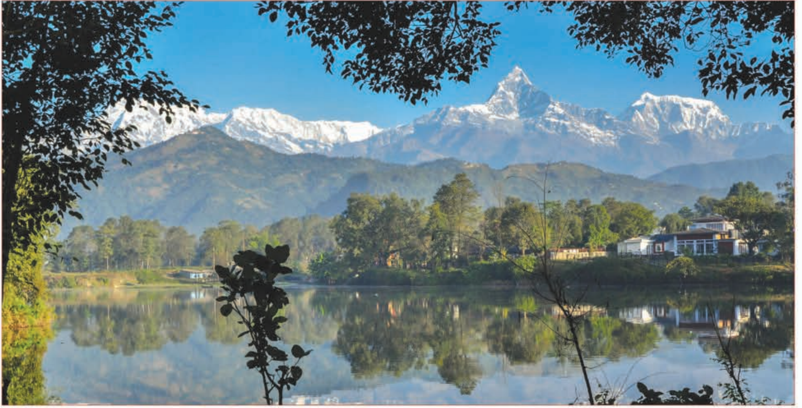
गाछापुच्छे हिमाल, फेवाताल