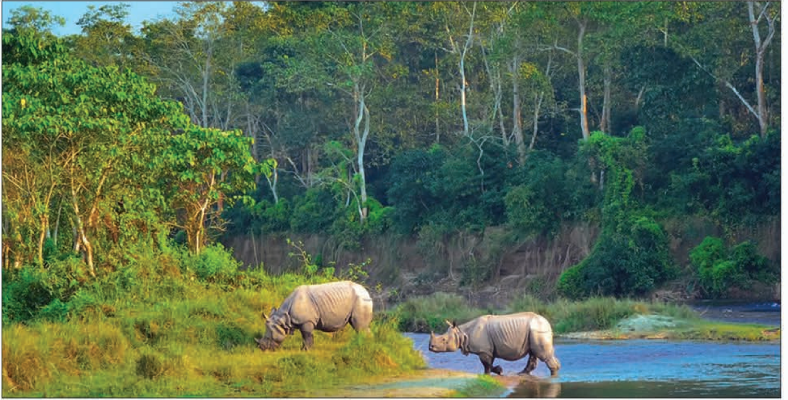
चितवन नेशनल पार्क