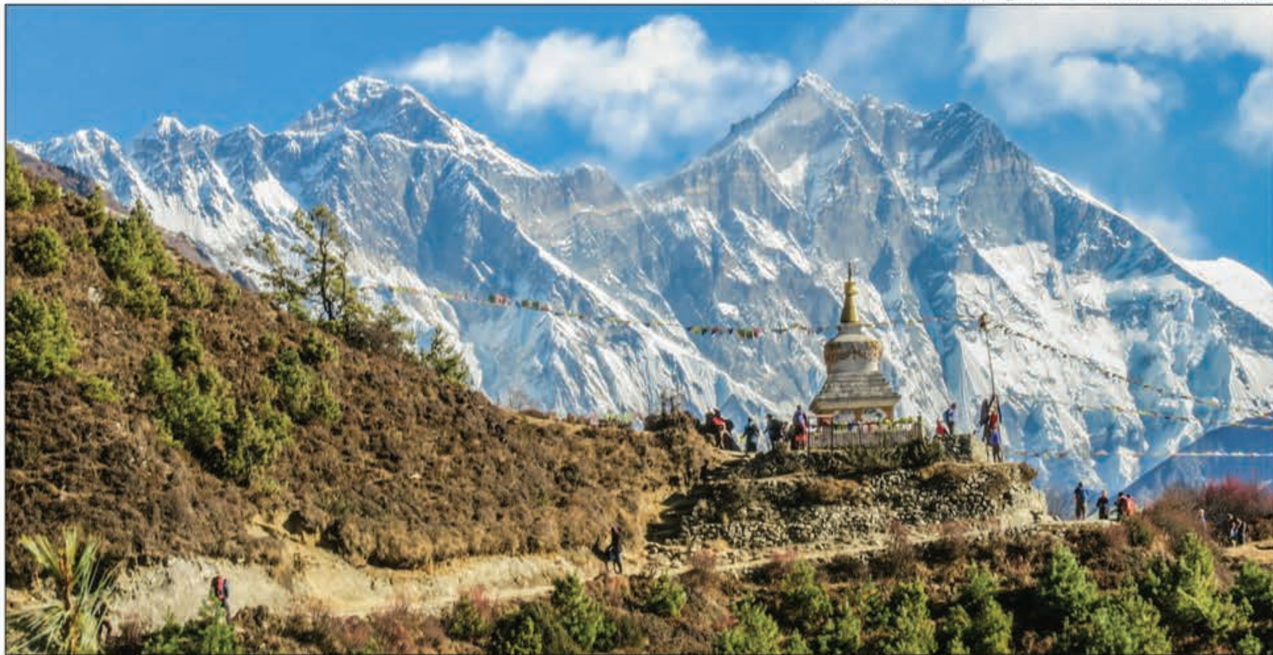
स्तुपा, काठचे बजार