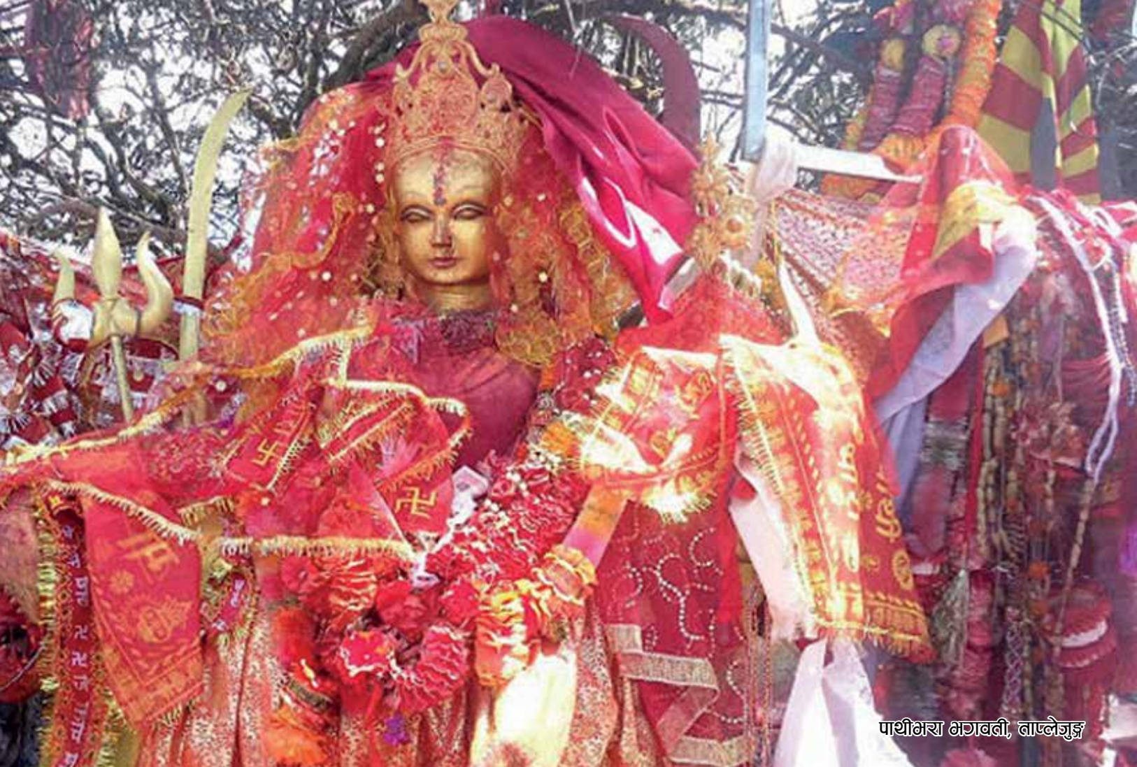
पाथीभरा भगवती, ताप्लेजुङ